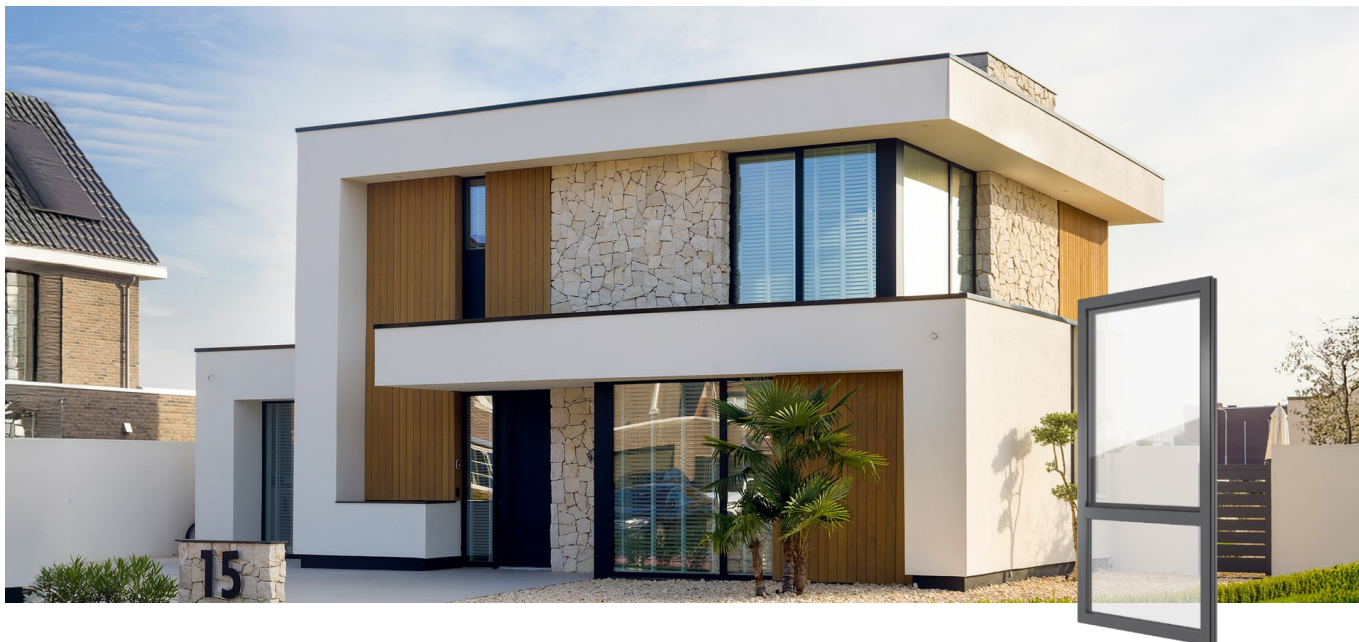
FIN-Project Nova-line 78/88 Aluminium-Aluminium