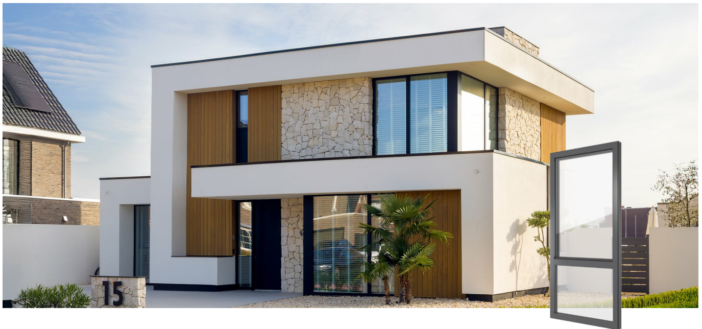
FIN-Project Nova-line 78/88 Aluminium-Aluminium