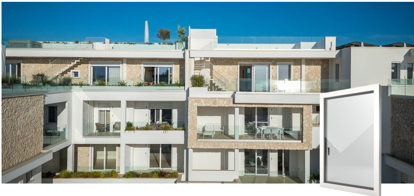
FIN-Window Nova-line 77 PVC-PVC