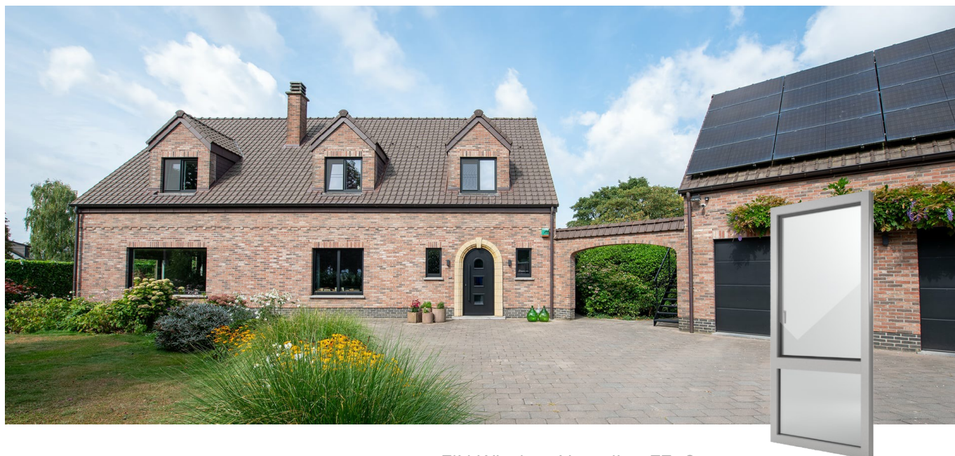
FIN-Window Nova-line 77+8 Aluminium-Kunststof