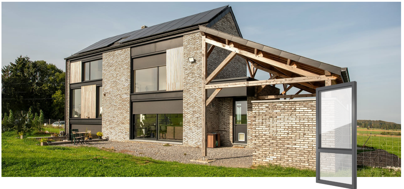
FIN-Project Nova-line 78/88 Aluminio-Aluminio