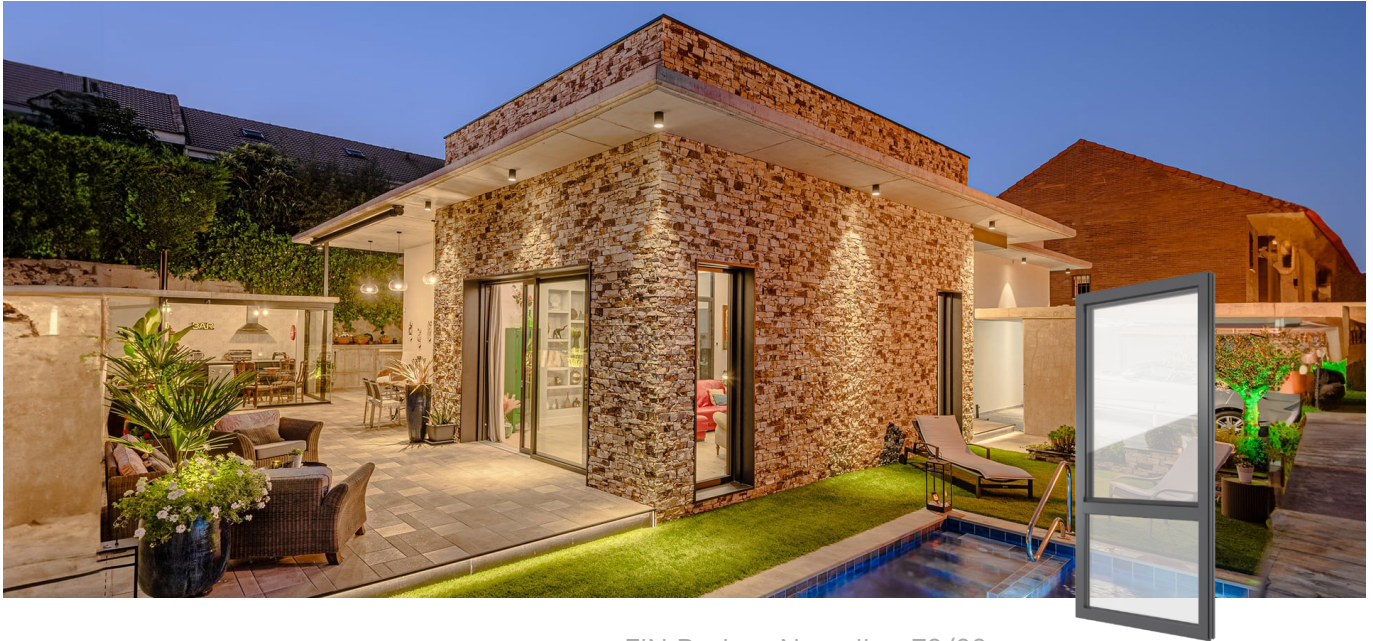
FIN-Project Nova-line 78/88 Aluminio-Aluminio