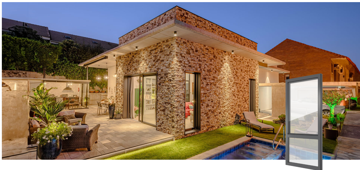
FIN-Project Nova-line 78/88 alluminio-alluminio