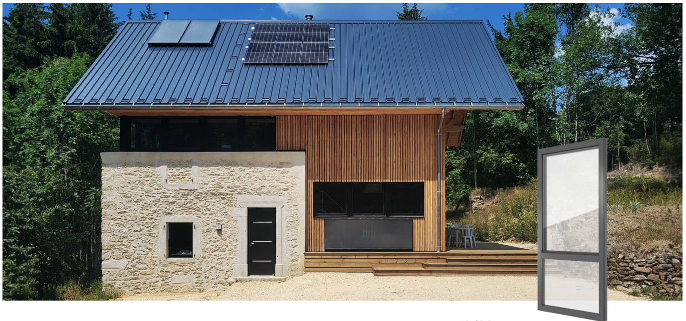
FIN-Project Nova-line 78/88 Aluminium-Aluminium