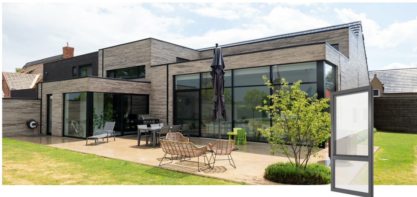
FIN-Project Nova-line 78/88 alluminio-alluminio