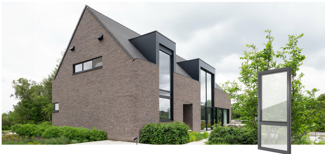
FIN-Project Nova-line 78/88 alluminio-alluminio