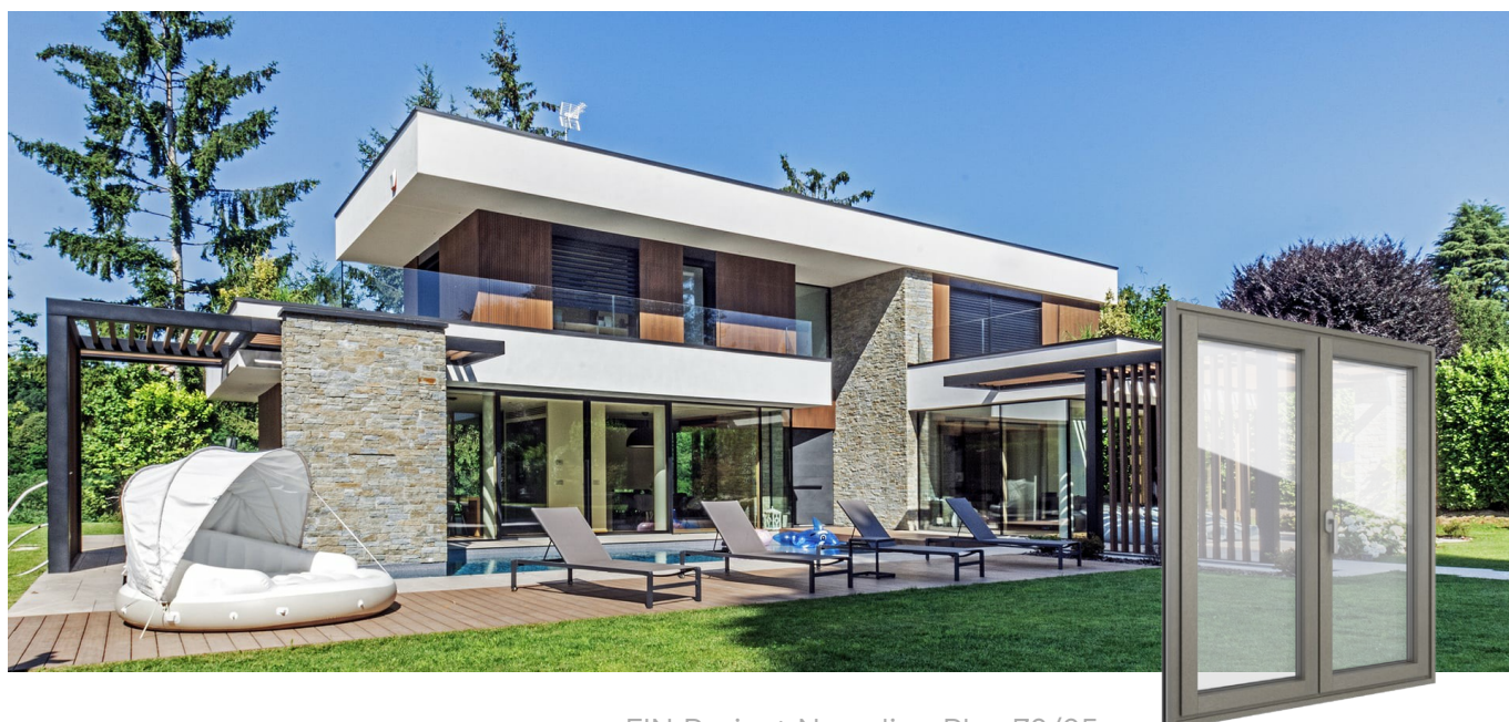
FIN-Project Nova-line Plus 78/95 Aluminium-Hout