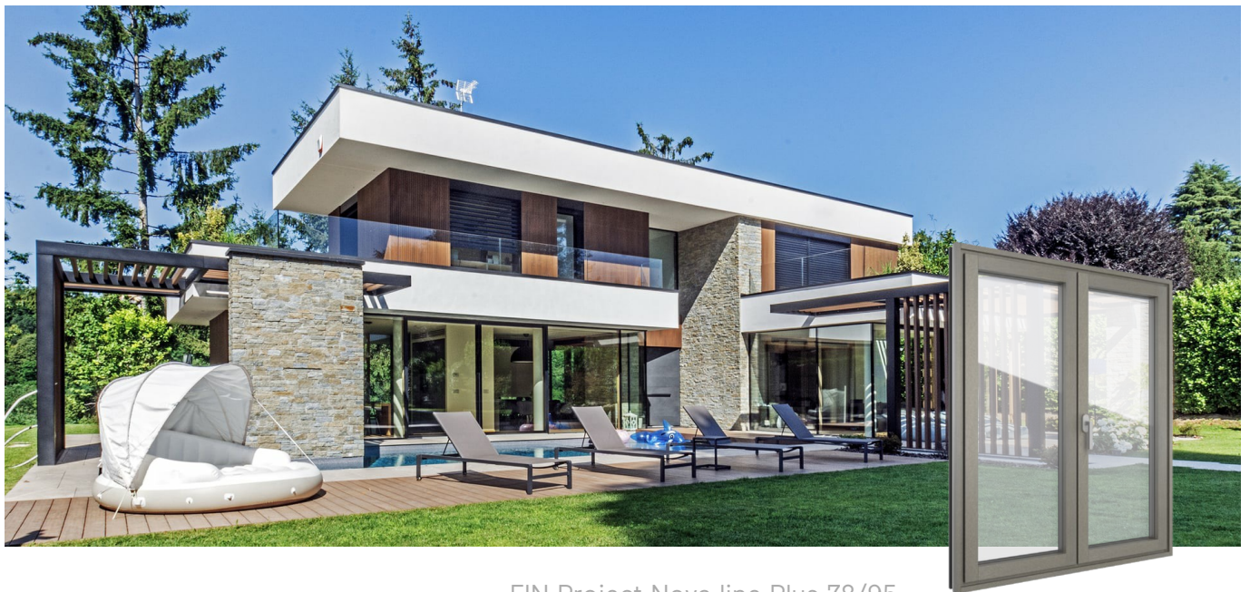
FIN-Project Nova-line Plus 78/95 Aluminio-Madera