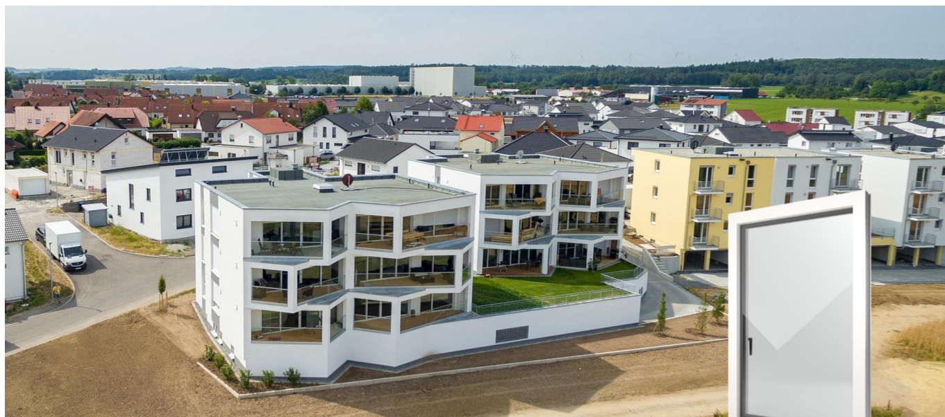
FIN-Window Nova-line 90 PVC-PVC