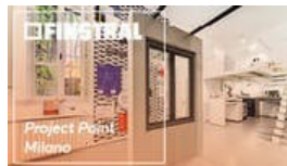
Finstral Project Point Milano Corso Garibaldi, 117 20121 Milano Italia

contract-service@finstral.com finstral.com/milano-project-point