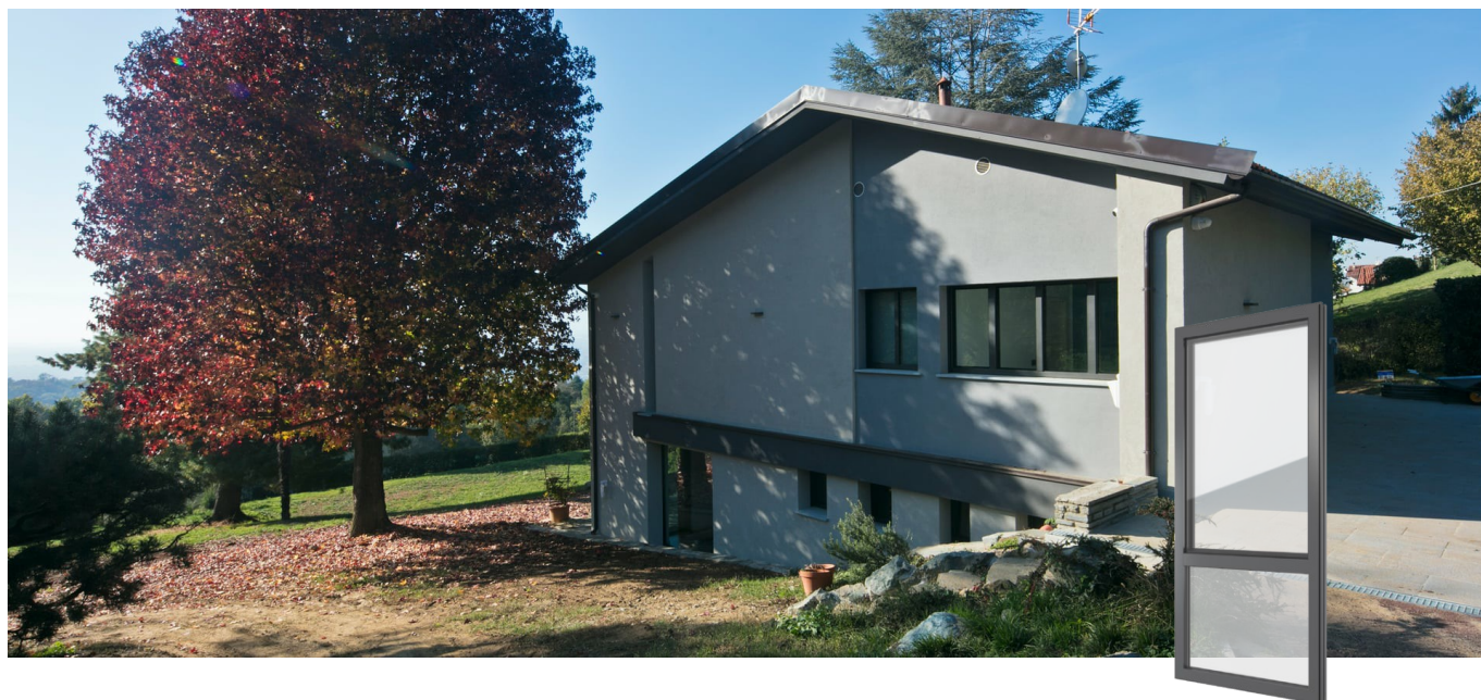
FIN-Project Nova-line 78/88 alluminio-alluminio