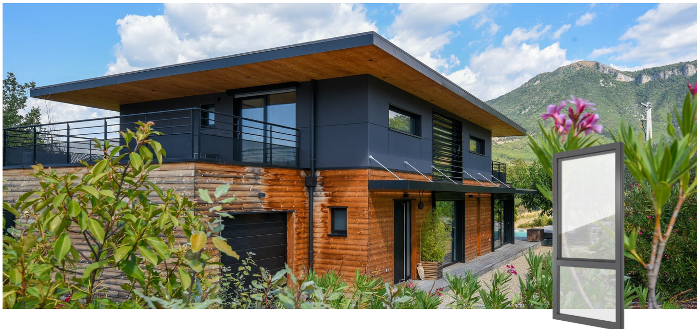
FIN-Project Nova-line 78/88 Aluminium-aluminium