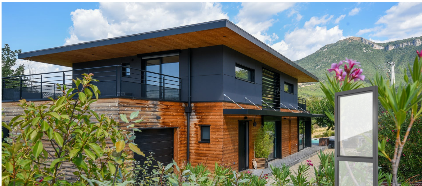
FIN-Project Nova-line 78/88 Alumínio-alumínio