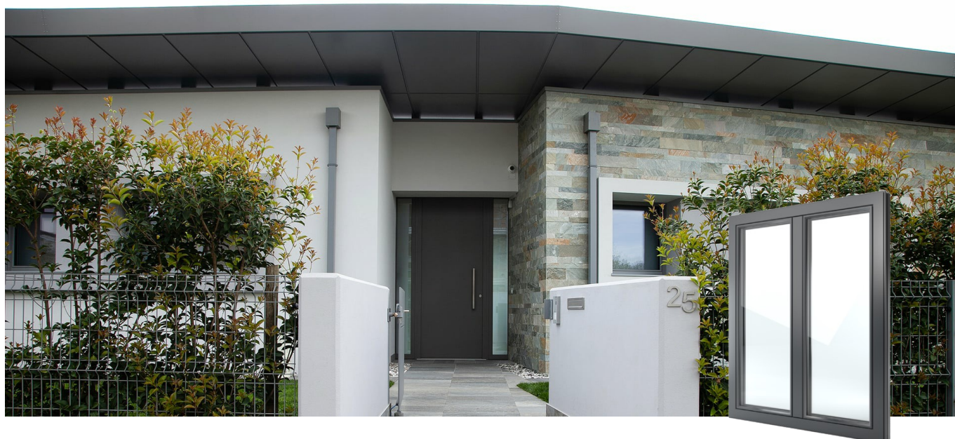
FIN-Project Classic-line 78/88 Aluminium-Aluminium