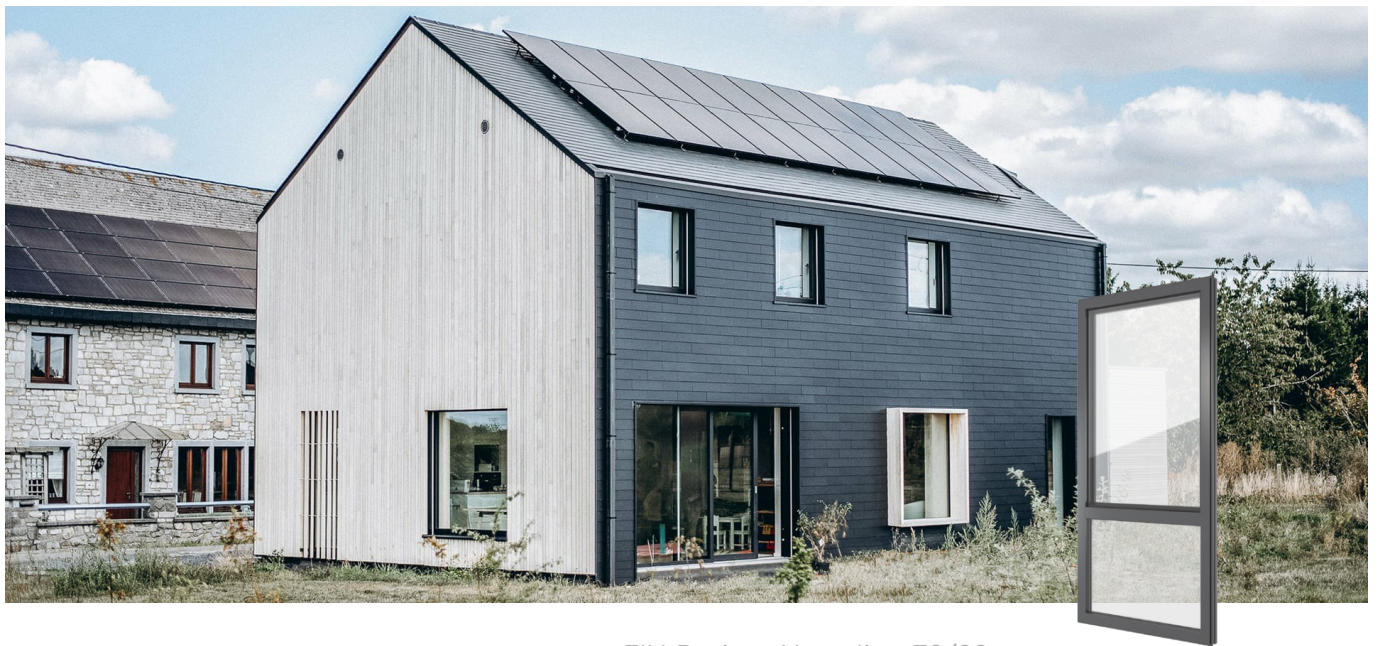
FIN-Project Nova-line 78/88 Aluminio-Aluminio