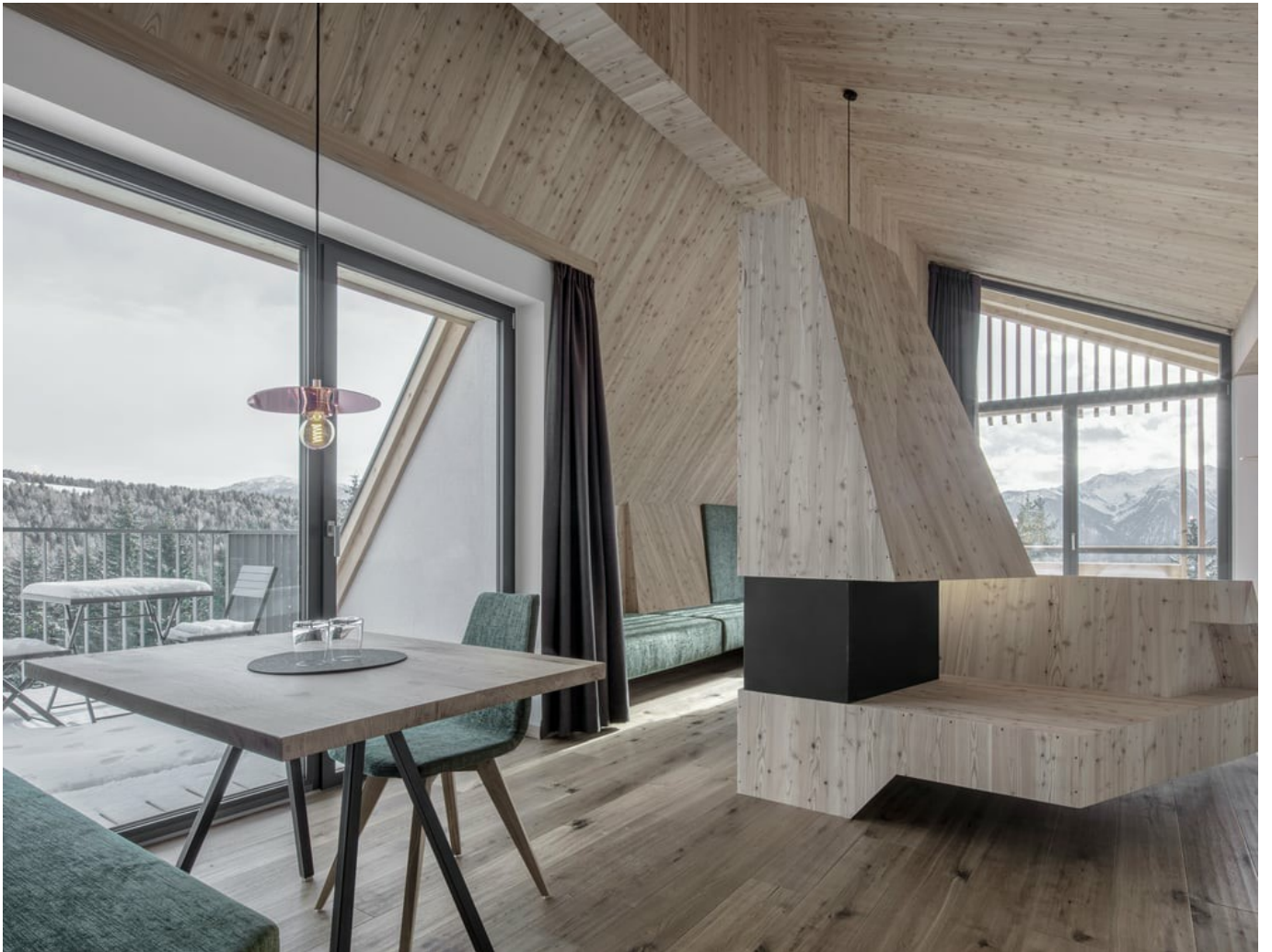
Dolomieten in zicht! De Oberhauser hut FIN-Project voor een ruim uitzicht.

www.finstral.com/nl/referenties/dolomieten-in-zicht-de-oberhauser-hut/311-3933.html