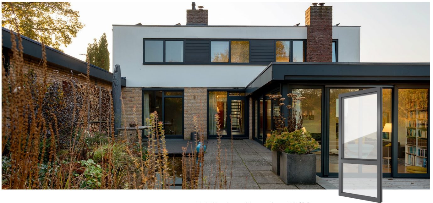
FIN-Project Nova-line 78/88 Aluminium-Aluminium