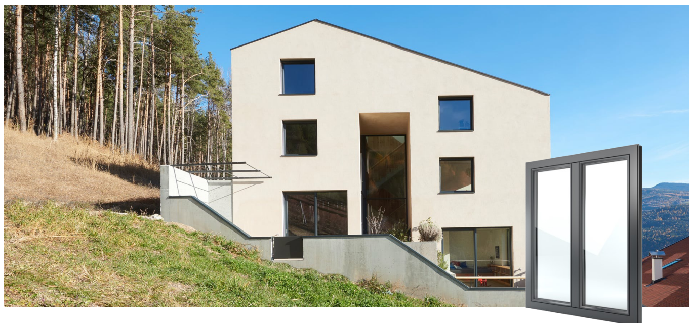
FIN-Project Classic-line 78/88 alluminio-alluminio