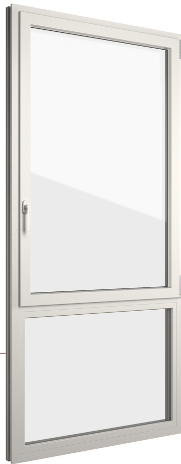
Afbeelding in éénvleugelige uitvoering met onderlicht, buiten aluminium castagno L13 en binnen kunststof wit gewalst 42