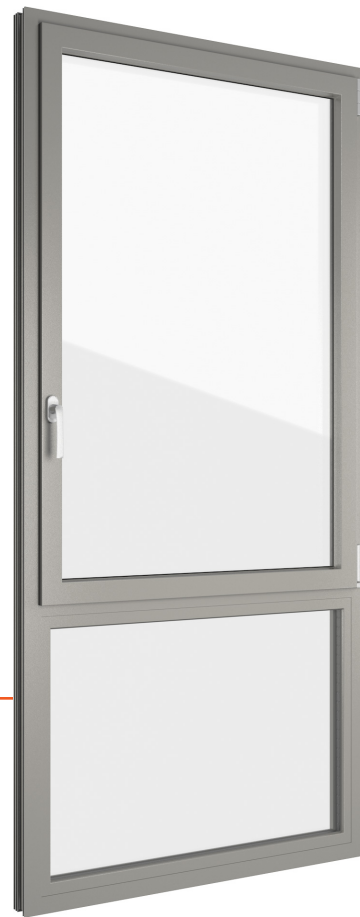
Afbeelding in éénvleugelige uitvoering met onderlicht, buiten en binnen kunststof grijs 06