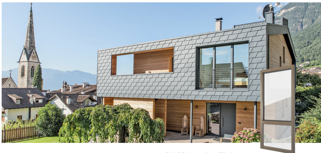
FIN-72 Nova-line 72+8 Aluminium-PVC