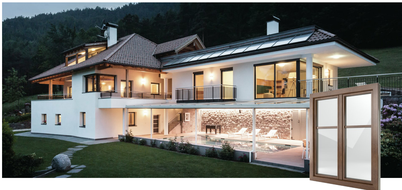
FIN-Window Classic-line C 90+8 Aluminium-PVC