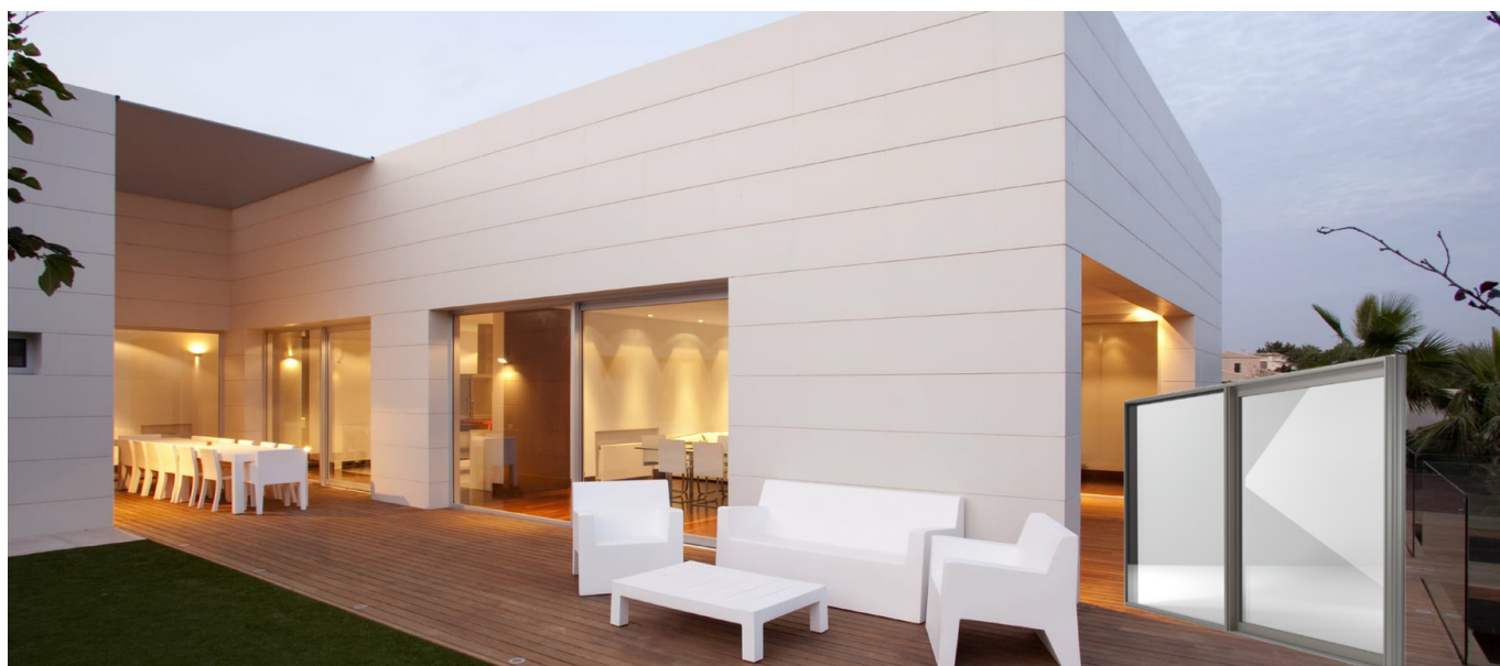
FIN-Slide Classic-line Aluminium-aluminium