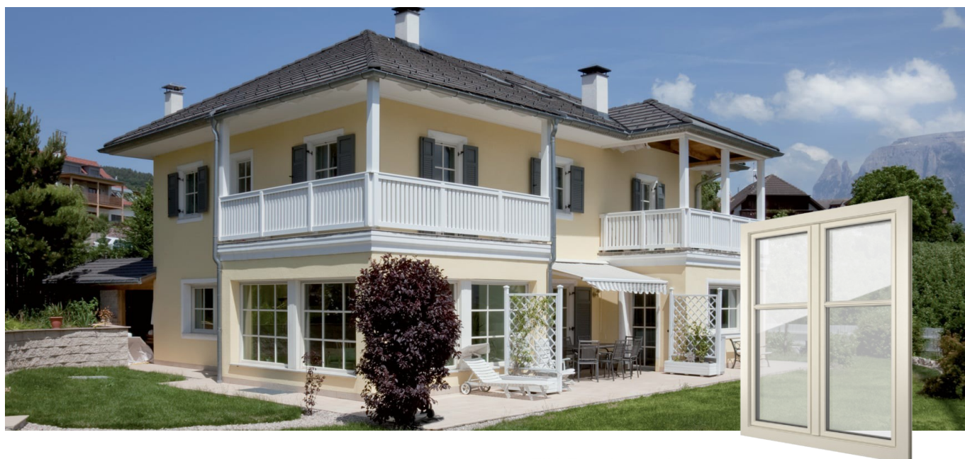
FIN-72 Classic-line Kunststof-Kunststof