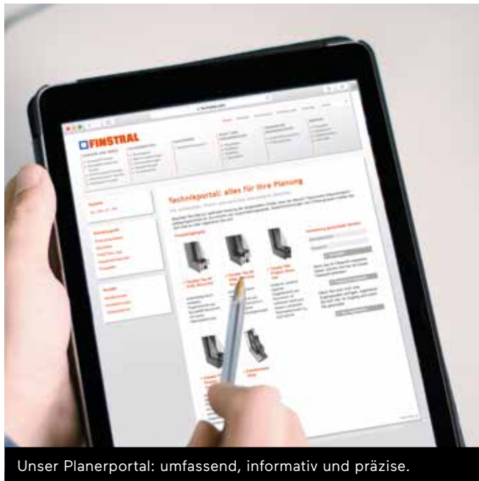
Unser Planerportal: umfassend, informativ und präzise.

Einfamilienhaus? Firmensitz? Die Renovierung einer Stadtvilla? Um genau planen zu können, brauchen Sie exakte Informationen – knapp und präzise zusammengefasst. Deswegen stellen wir Ihnen für jede Planungsphase alles Wissenswerte über Finstral-Produkte zur Verfügung. So sind Sie und Ihre Bauherren immer bestens informiert.