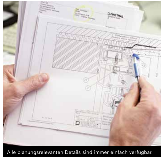
Alle planungsrelevanten Details sind immer einfach verfügbar.

Prüfzeugnisse und Konformitätserklärungen können Sie online abrufen. Bei detaillierten Fragen hierzu oder zu Produktnormen wenden Sie sich direkt an Ihren Planerberater. Er stellt gegebenenfalls auch gerne den direkten Kontakt zu unserem Finstral-Experten für europäische Produktnormen her.