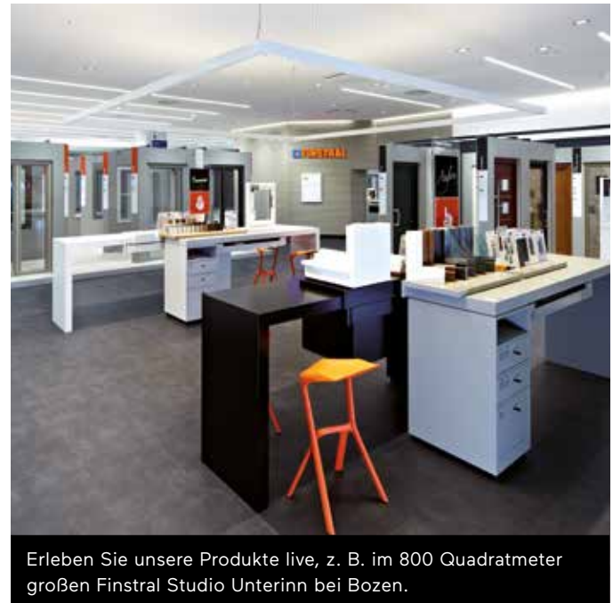
Erleben Sie unsere Produkte live, z. B. im 800 Quadratmeter großen Finstral Studio Unterinn bei Bozen.

Sie interessieren sich für eines unserer Referenzobjekte und möchten es persönlich in Augenschein nehmen? Auch das arrangieren wir gerne für Sie.